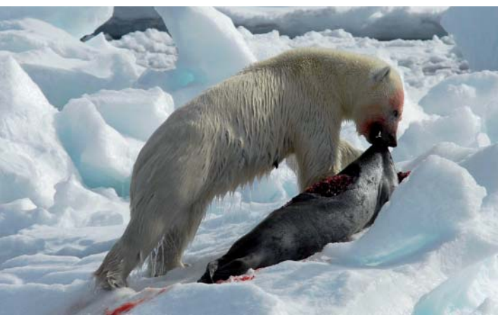
Ijsbeer met Baardrob in Spitsbergen