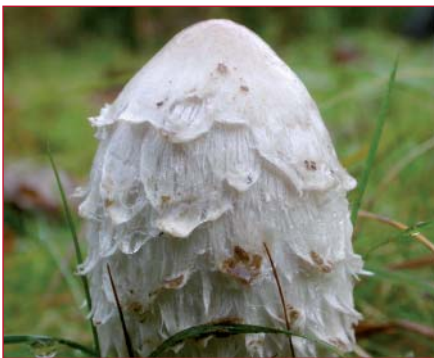
Geschubte inktzwam