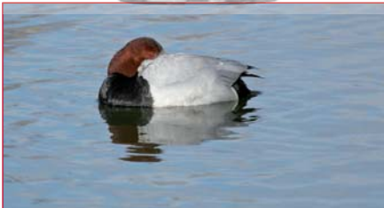
Tafeleend - © Rudy Vansevenant

Vertrekken we met paraplu, geeft een mild zonnetje ons een pril lentegevoel of wil het begot nog eens sneeuwen of vriezen in deze wintermaand? Wie durft dit nog te voorspellen? Wat het ook moge zijn, we starten hoe dan ook met onze traditionele borrel en met gemeente wensen voor een gezegend jaar vol natuurgenoet.