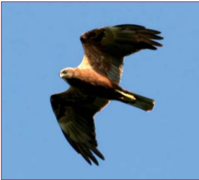
Bruine kiekendief

Een reis door het heden en de toekomst van de vogelgebieden in de Antwerpse havens op de Linkerscheldeoever met aansluitend een schemerig bezoek aan de kiekendieven van het unieke Verdrongen Land van Saeftinghe.