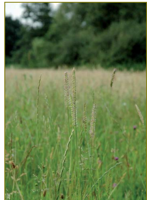
Kamgras op Neerland

In ieder geval werken we nu nog verder om een advies te verlenen over het ganse inrichtings- en beheerplan, wat ergens in de loop van oktober zal worden voorgelegd.