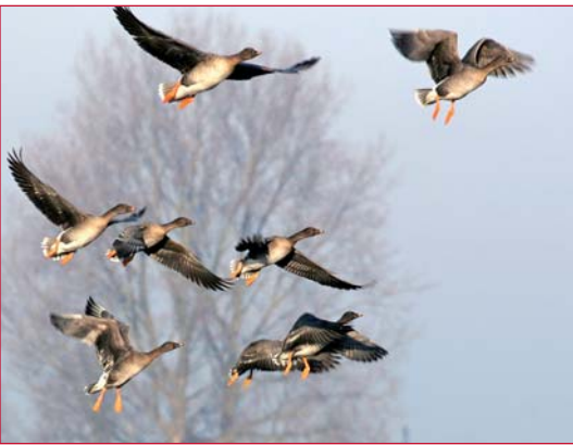
Rietganzen in de vlucht

Het is lang geleden, maar we wagen het er nog eens op: vandaag gaan we op zoek naar de (weinig) Taigarietganzen ( Anser fabalis ) die in deze streek nog te vinden zijn. De omgeving van de Grote Peel is één van de mogelijke overwinteringsplaatsen van deze zeldzame (onder)soort. In de voormiddag speuren we met de wagens de wei- en akkerlanden af en hopen deze zeldzaamheden te ontdekken tussen de duizenden Toendrarietganzen, Kol- en Brandganzen die hier komen overwinteren. Op hoop van zegen dus ...!