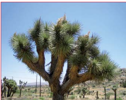
Yoshua Tree Nature reserve

Als eerste winteravond van het jaar, krijg je vanavond 2 fotoreeksen met commentaar van eigen leden.