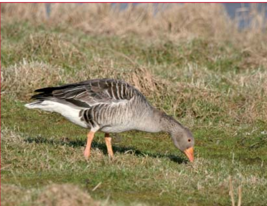
Grauwe gans

De dagen worden weer korter, de herfst is al enige tijd in het land, de winter kondigt zich zelfs stilaan aan. Dit is natuurlijk ook te merken aan de avifauna: de "Vriezeganzen" zijn terug in onze streken. Vandaag bezoeken we, zoals we al vaker hebben gedaan, de Vlaamse Oostkustpolders. Daar brengen elk jaar vele duizenden ganzen, voornamelijk Kol- en Kleine Rietganzen, hun winter door. Hun broedgebieden in het hoge noorden zijn hen 's winters immers veel te bar. Ze vinden er geen voedsel meer, want dat bevindt zich dan gedurende maanden onder een meters dikke sneeuwlaag. Het is voor de ganzen daarentegen aangenaam vertoeven in Vlaanderens natte weiden, waar ze zich de buik rond kunnen eten aan het sappige gras en kruiden. We gaan dan ook een kijkje nemen hoe het hen dit jaar bij ons vergaat. Daarnaast houden we natuurlijk ook al het andere gevogelte in het oog, in de hoop misschien één of andere zeldzamere wintergast in het vizier te krijgen.