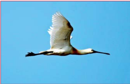
Lepelaar in vlucht

Het is weer volop trektijd voor duizenden zangvogels die bij voorkeur overdag vliegen.