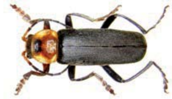
Zwartpootsoldaatje ( Cantharia fusca )

Weekschildkevers die voorkomen op allerlei kruiden o.a. op schermbloemen.