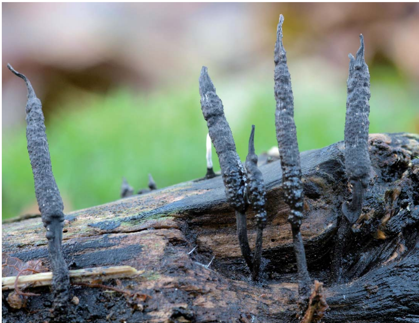
Geweizwammetje (fertiele vorm)

Ons groepje had er een gevarieerde dag opzitten dankzij Luc en Rudy!