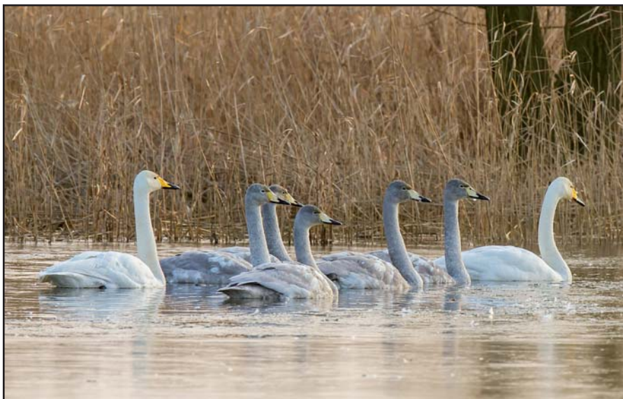
Familie Wilde zwanen nabij het Markiezaat

Leiding: Rudy Vansevenant - 0475/49 03 68