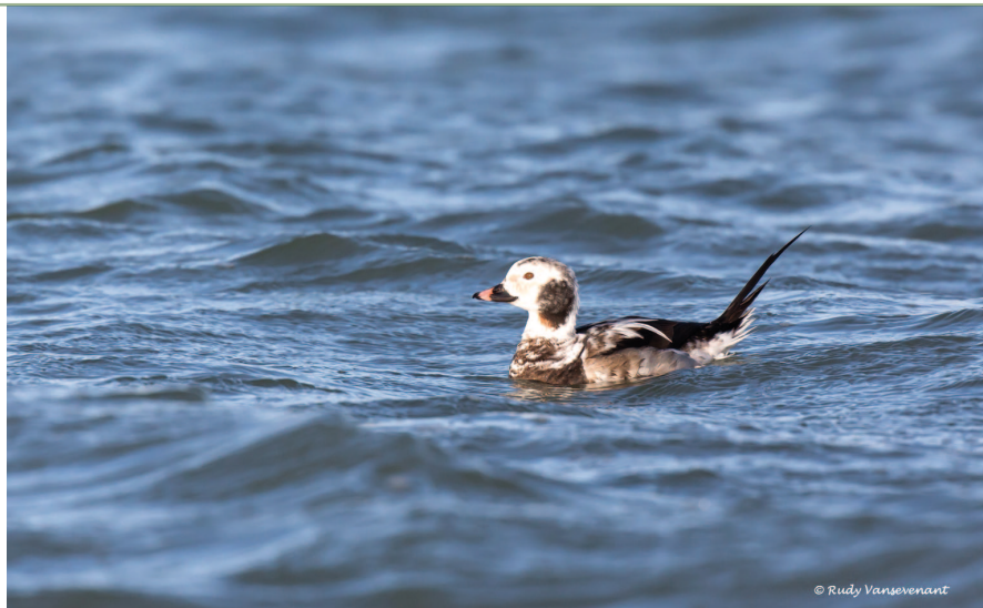
IJseend aan de Brouwersdam