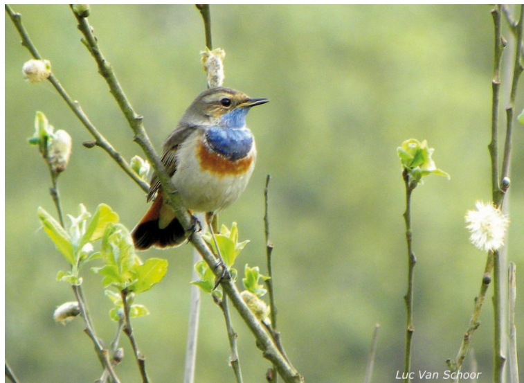
Blauwborst- © Luc Van Schoor

Het kasteeldomein is sinds 2012 publiek domein geworden en vormt samen met Fort V een groene zone van ongeveer 90 ha. Het domein bestaat uit een kasteelpark met vijver en daarbij aansluitend een bosgedeelte. ARDEA bezocht het al eerder voor spechtenonderzoek.