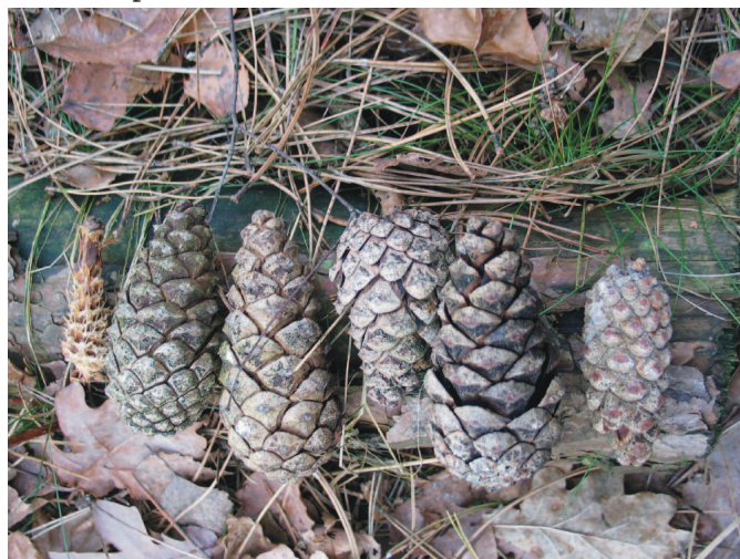
Zwarte den - naalden en vruchten

Bepaalde soorten hebben zelfs geen naalden, maar afgeplatte schubben zich rond de takken drukken (cypres).