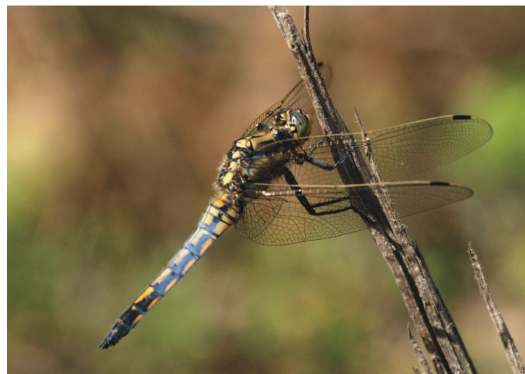
Gewone oeverlibel

Gids: Rudy Van Cleuvenbergen - 03/ 464 05 57 (enkel 's avonds) rudy.vancluvenbergen@skynet.be