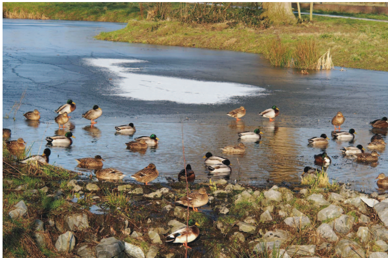
Afspraak aan het wad

Waterrijke omstandigheden bevorderen een gevarieerde natuur; enkele voorbeelden: