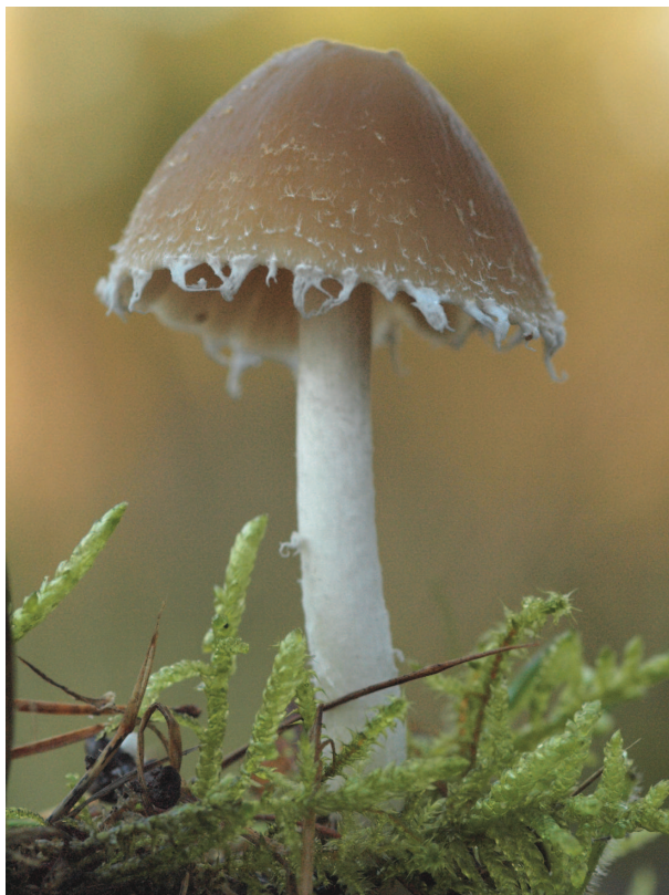
Franjehoed spec.