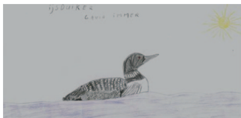
(tekening: Hannes – wij kregen geen zon en een winterkleed)

Aan de dam zelf, het tussenschot tussen Veerse Meer en Noordzee, stapten we een eerste keer uit om richting strand te wandelen. Een blik over het meer leverde eerst toch nog Krakeend, Fuut, Geoorde fuut versus Kuifduiker (een uitdaging om de verschillen tussen beiden te zoeken in de winter!), een fraaie groep Brilduiker, Dodaars en Zaagbek op. En zelfs een eerste glimp van de aanwezige IJsdruiker, die het vooral toch op "duiker" hield. Dan even door weer en wind over strand en duinen, met veel zeemeeuwen en een groepje Kanoeten erbij, om nadien bovenop de brug lange tijd te kunnen turen naar de fenomenale grote en imposante IJsdruiker. Wat een fantastisch monster. Rosse grutto en